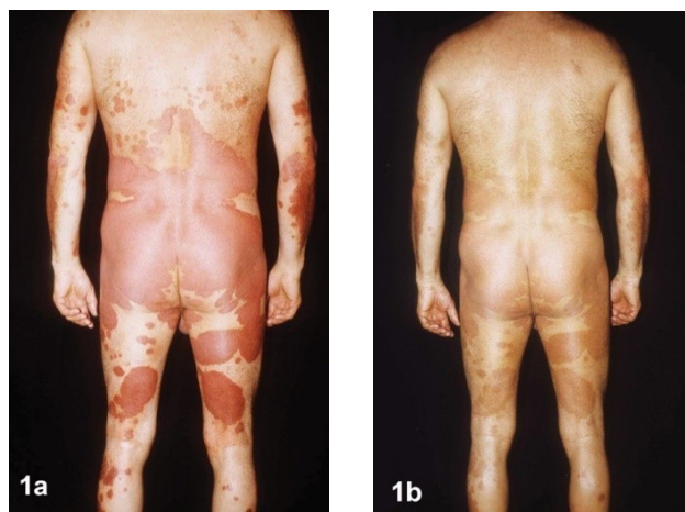
Hình 1. a): Tuần 0 – Trước điều trị; b): Tuần 6 – Sau điều trị sử dụng dòng sản phẩm Dr Michaels® (Soratinex®). Bệnh nhân nam, 38 tuổi mắc vẩy nến 8 năm nay. Bệnh nhân biểu hiện các tổn thương trên trong vòng 2 năm vừa qua. Trước đó, bệnh nhân được điều trị bằng cyclosporine A nhưng không có cải thiện rõ rệt. Mức creatinine máu tăng tới 280mmol/l, huyết áp 180/90mmHg. Bệnh nhân sử dụng 3 bộ sản phẩm Dr Michaels®. Liệu trình điều trị có hiệu quả 90% và dung nạp tốt. Chỉ còn lại tổn thương tăng sắc tố nhẹ. Ở tuần thứ 6 xét nghiệm cho thấy mức creatinin giảm xuống 128mmol/l và huyết áp là 160/75mmHg. Xét nghiệm mô bệnh học có kết quả bình thường.

Tính dung nạp thuốc là rất tốt. Chúng tôi lưu ý một số tác dụng phụ nhưng cảm giác nóng rất tạm thời khi khởi đầu điều trị ở khoảng 8% ca bệnh. Chúng tôi không quan sát thấy bất cứ tác dụng phụ bên trong nào, trong khi các xét nghiệm, phần lớn đánh giá chức năng gan và thận, ở thời điểm khởi đầu nghiên cứu, đã trở về bình thường sau khi dùng methotrexate, cyclosporine A và retinoid. Trong nghiên cứu này, chúng tôi theo dõi các thông số về hình ảnh và trên xét nghiệm như FW, glucose, cholesterol, triacylglycerol, bilirubin, GMT, ALT, AST, creatinin, acid uric và ure máu. Chúng tôi không quan sát thấy bất cứ bất thường nào.